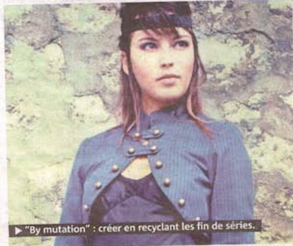
► "By mutation" : créer en recyclant les fin de séries.

"La mode éthique se définit par le respect de l'environnement, la responsabilité sociale des entreprises et la transmission des savoir-faire de chaque culture."