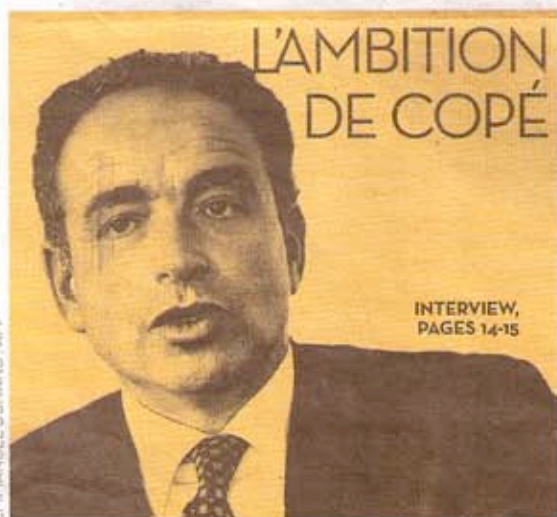
EMMANUEL DUNAND, AFP

CLEAR espion l'ancie Villepi la prés et s'est de Chi