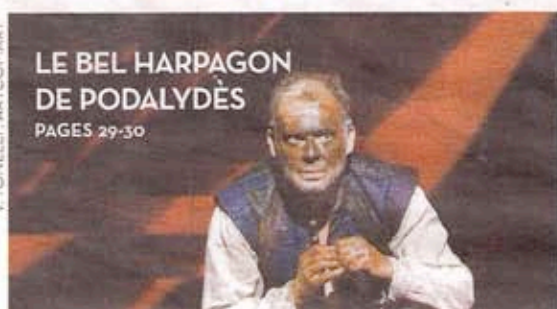
V. TONELLI, ARTCOMART