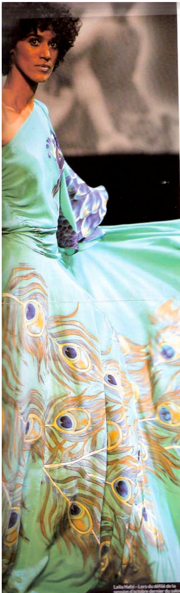
Leila Habi - Lors du défilé de la session d'octobre dernier du salon